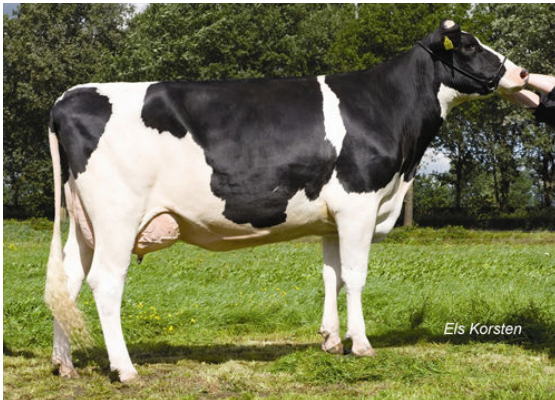
ANDERSTRUP BOLTON ELITA Dam